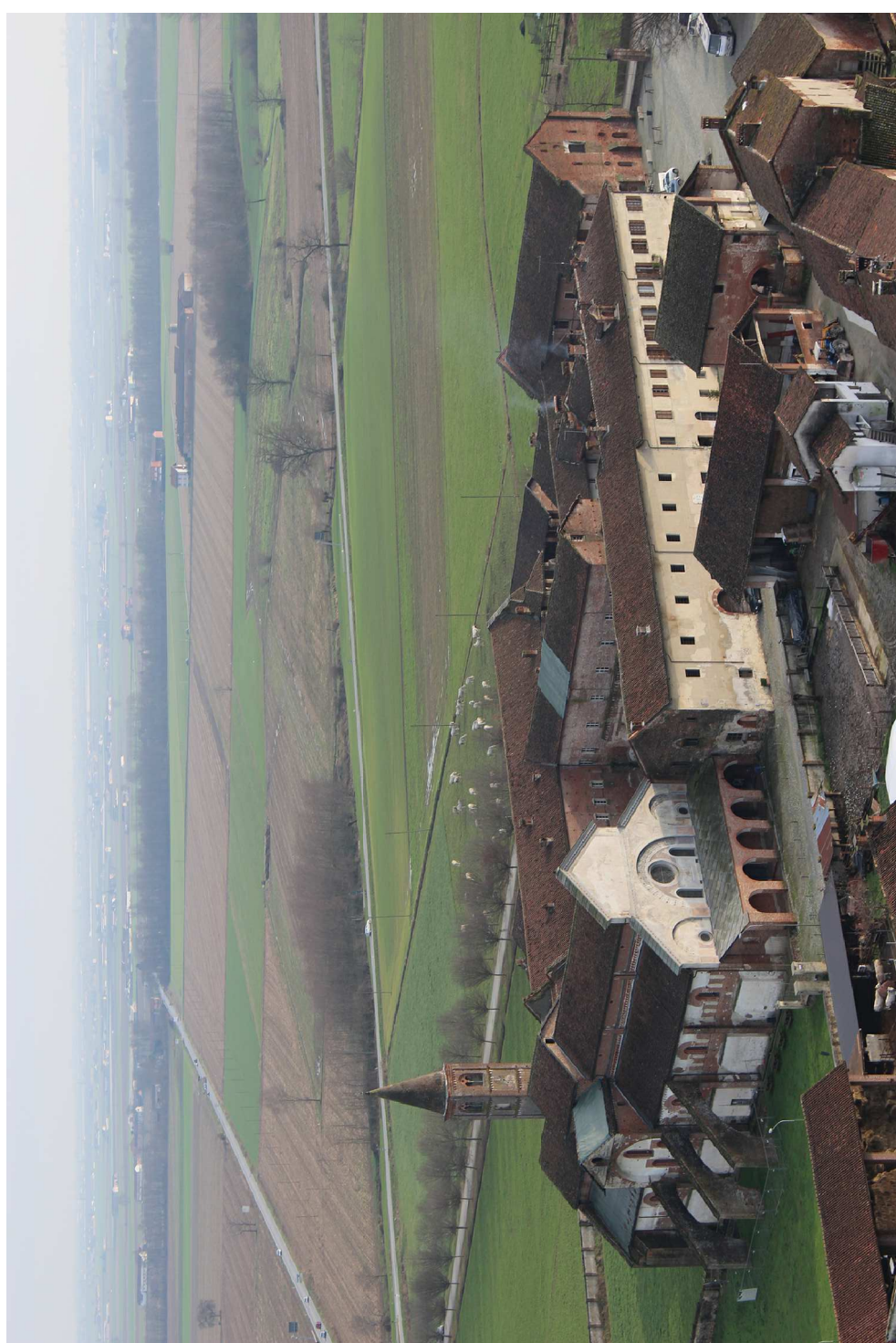
Fotografia Aerea - Ing. Novarese