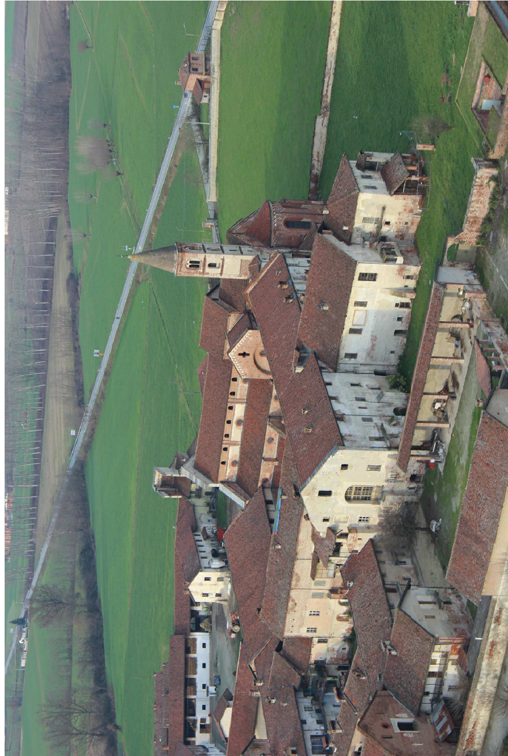
Fotografia Aerea - Ing. Novarese